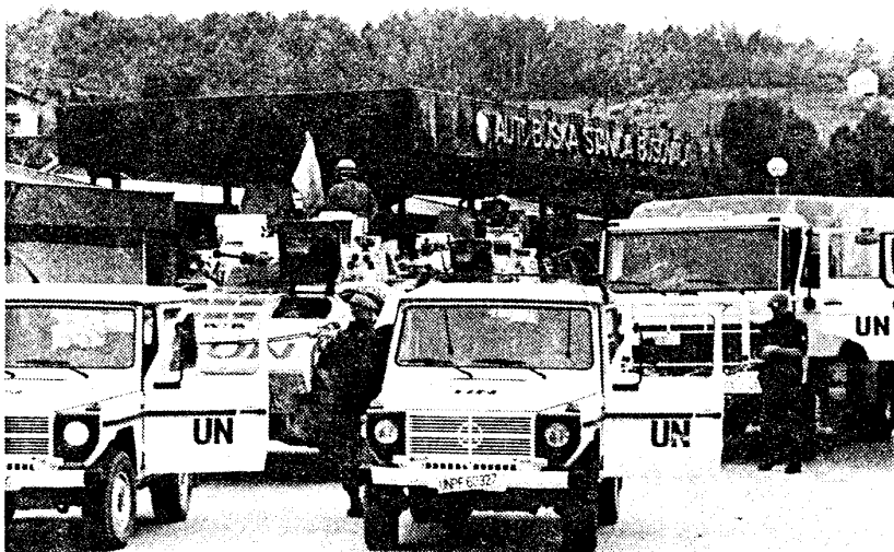
Het derde peloton rijdt nu, net als het viertonnerpeloton van de Bravo compagnie vooral lokale ritten. Hier arriveert de Britse escorte voor een rit naar Kacuni.

Het liefst had ik een douche willen vervolg op pagina 5