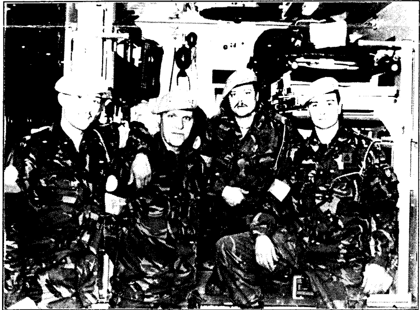
Reddingswerkers bij hun ziekenauto

een dokter gewaarschuwd en Keja moet een Canadees sommeren om de "Operations room" van ons Transportbataljon op te roepen. Tevergeefs proberen de Britten met behulp van een takelwagen het zware voertuig enige meters omhoog te takelen om zo de reddingsactie te vereenvoudigen. Het enige resultaat is een geknapte stalen ketting. Maar over het lot van de in het voer-