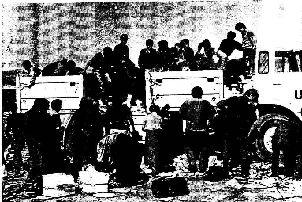
De bewoners van de vuilnisbelt maken in een mum van tijd de viertonner schoon.

'Sinds ik verteld heb dat we uit Nederland komen, schijnt overigens iedereen familie te hebben in Nederland', vult Baselmans aan. 'Niettemin versturen we soms post van de vluchtelingen naar Duitsland of nemen we wel eens een fles shampoo of zeep voor ze mee. De zigeuners bedelen