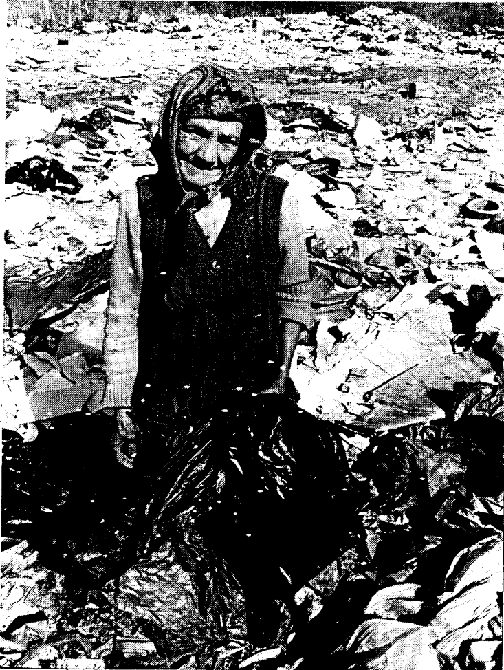
Een bekend gezicht: het vrouwtje met een zilveren tand in haar mond

Logistieke konvoien brengen levensmiddelen en brandstof naar het Transportbataljon in centraal-Bosnië. Maar wat gebeurt er met het afval en kolengruis? Toch gewoon naar een vuilnisbelt? Ja: en wel naar de vuilnisbelt van Vitez. Nee: geen gewone vuilnisbelt, want je ruilt daar het afval om in emoties.