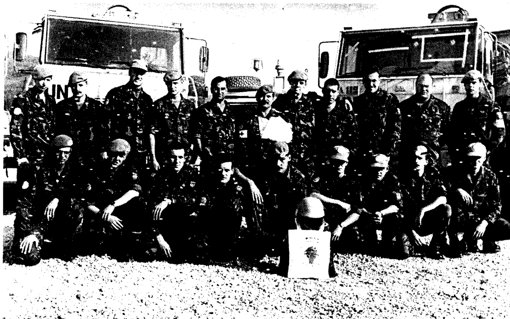
Het 1 e peloton Alpha voor hun beschoten tientenners

Op de lokatie van de Alpha-compagnie van het Transportbataljon kijkt het 1 e peloton naar hun tientenners en MB's. Geen voertuig is ongeschonden; kogels hebben overal hun weg door het materieel gevonden. Het 'schietincident' is intussen voldoende bekend. Maar wat speelt zich daarna af binnen de hoofden van de betrokkenen?