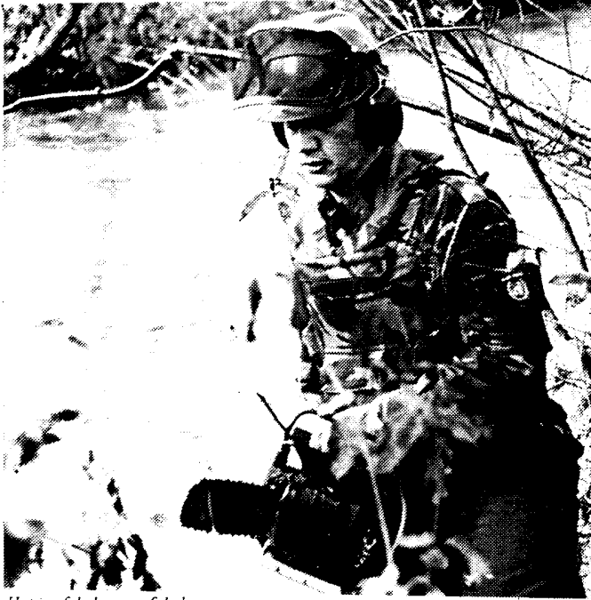
Het is of de boom of de boys

De granaat was gericht op het HVO-hoofdkwartier in Busovaca, maar kwam terecht op vijftig meter van de wachtbunker. Man, ik schrok me het leplazerus.”