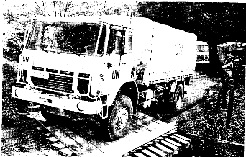
Met veel gekraak rijdt het konvooi over een geïmproviseerd bruggetje

De vorige twee konvoeien van ons bataljon moesten zelf in Novi Travnik lossen terwijl mortiergranaten plotseling eng dicht