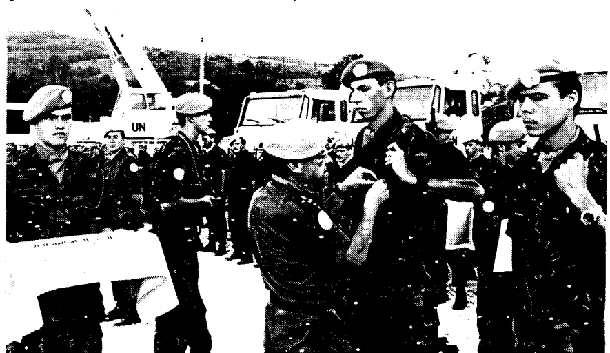
De medailles liggen keurig uitgesteld op een schaal

de rijen van de Bravo-compagnie. Deze woorden die 'niets is ons te dol' betekenen, is het in het Kroatisch vertaalde gezegde van het transportbataljon. De mannen en vrouwen van deze compagnie slaan vervolgens een glas lokale drank achterover. Wat verderop