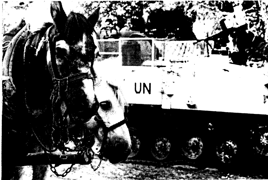
Paard en wagen ontmoet een Britse warrior, bij een confrontatie tussen de twee sneeu's: een karrelwiel

bij hen neerkwamen. Toen was er geen hulp. Nu wel. De lucht kent vandaag dan ook geen hoog loodgehalte. Binnen een half uur wordt alles gelost door een flink aantal bewoners die met elke zak er witter uit komen te zien. Als ze alles hebben gelost zijn ze onherkenbaar. Capuchons