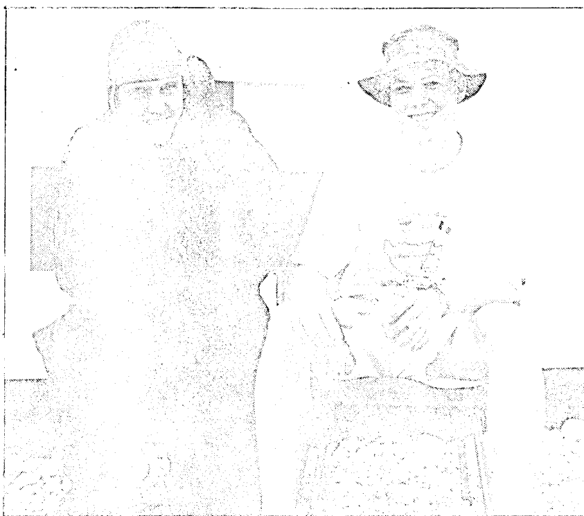
Het kan vriezen, het kan dooien in Bosnië

verkleuring optreden die gevoelloos en koud is, waarna deze rood verkleurt en zeer pijnlijk en heet wordt. Deze aandoening kan met name voorkomen bij te lang stilstaan. Bijvoorbeeld tijdens het wachtkloppen. Dit kun je voorkomen door regelmatig te lopen en je tenen te bewegen. Hierdoor houdt je de bloedsomloop op gang. Verder is het raadzaam om de schoenen niet te vast te knopen, aange-