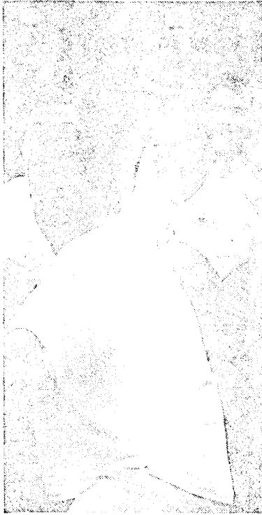
Touwtrekken of het bekende Monatoetje nadoen?

Het organiseerd comité van de staf blijkt na afloop zo teleurgesteld over de uitslag, dat ze alle wedstrijdgegevens onmiddellijk vernietigt, voordat de pers ('t Geitenpad) er beslag op kan leggen. Focci staf! Volgende keer gewoon beter.