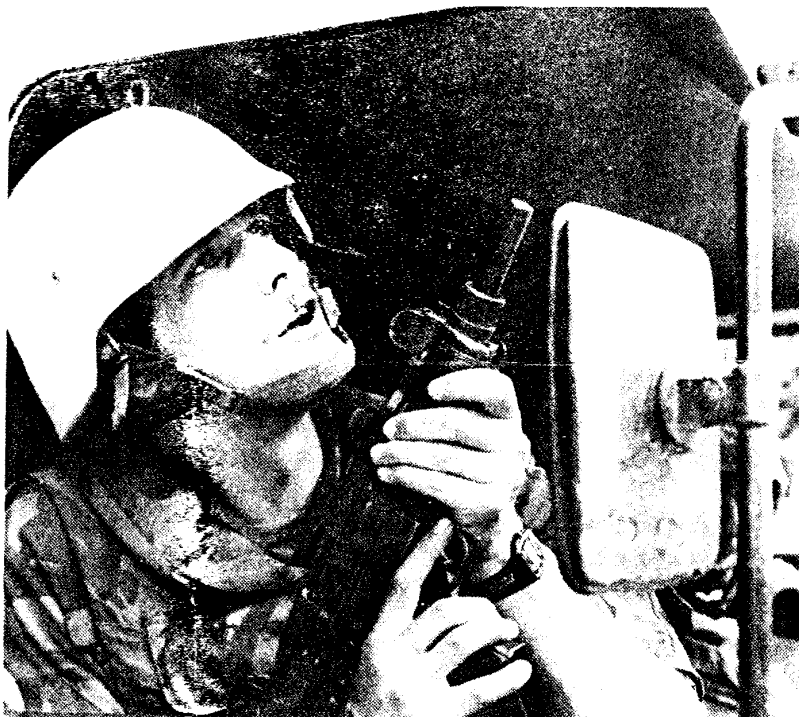
"Waar komt dat schot vandaan".

Met medische goederen van Handicap International vertrekt op woensdag 15 september het 3e Peloton Alpha compagnie van Busovaca naar Pazaric. De lading is bedoeld voor een kliniek van geestelijk gehandicapten. Voor deze reis was ons grootste angst Sierra 1, een Servische grenspost waar ze wel eens erg moeilijk kunnen doen over onder meer ladingen en de juiste papieren. Toch is in tegenstelling tot veel Kroatische en Moslim-posten Sierra 1 goed georganiseerd. De uniformen zijn zowaar identiek, de wachters zijn goed geïnstrueerd over de te voeren richtlijnen en er is zelfs altijd iemand aanwezig die de Engelse taal machtig is. Zonder veel problemen passeren we deze wacht. Ook bij het volgende checkpoint in Hadzici worden we vriendelijk bejegend bij de controle van ID's en lading. Totdat de weg voor ons vol begint te stromen met vrouwen - van alle leeftijden - die ons konvooi de doorgang belemmeren. Zij vertellen over hun kinderen die in Pazaric gevangen zouden zitten en over de de gruwelijkheden die hen zelf daar zijn overkomen. Om het leed kracht bij te zetten ontbloeit een vrouwtje tot onze grote verbazing één van haar borsten. Een kogelwond is duidelijk zichtbaar. Om de arm draagt ze een zwarte rouwband: voor haar zuster die de verschrikkingen niet heeft overleefd. Hoe we ook onder-