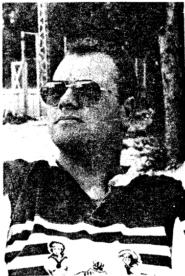
Dromend over België.

tijd? Van Snick: "Maar ja, natuurlijk! Hij is een officier, hè?"