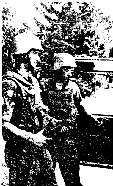
Gecontroleerd bij een roadblock.

Chargés de matériel médical provenant de 'Handicap International', les Veh du 3e PI de la Cie Alpha ont quitté mercredi 15 septembre Busovaca pour se rendre à Pazaric. Le chargement est destiné à l'hôpital des handicapés mentaux. Durant ce voyage, le passage du poste frontière Serbe Sierra 1 pouvait poser des problèmes par les contrôles strictes des documents et du chargement. Toutefois, comparé à la majorité des postes Croates et Musulmans, celui-ci semble bien organisé. Les gardes connaissent leur travail, leurs uniformes sont identiques et il y a même en permanence quelqu'un qui parle anglais. Sans difficulté nous franchissons ce poste frontière. Au checkpoint suivant, à Hadzici, le contrôle des cartes ID et du chargement se fait dans la bonne humeur. Mais un peu plus loin le voyage est interrompu par un grand nombre de femmes, de tout âge, qui bloquent la route. Elles nous racontent que leurs enfants sont prisonniers à Pazaric et qu'ils font l'objet de sévices cruels. Pour la crédibilité, une