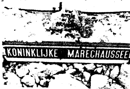
Het rotsje in de branding dat de onverlaten achterlieten op de plaats van de oorspronkelijke steen.

Na enig aandringen deelt hij aarzelend mee dat inmiddels wel enige vorderingen zijn gemaakt. Op enkele in beslaggenomen bierblikjes zijn zeer veelbelovende vingerafdrukken gevonden. 'Er is echter een probleem', verklaart Van Wijlick bedrukt, 'wij missen hier de apparatuur om de juiste analy-