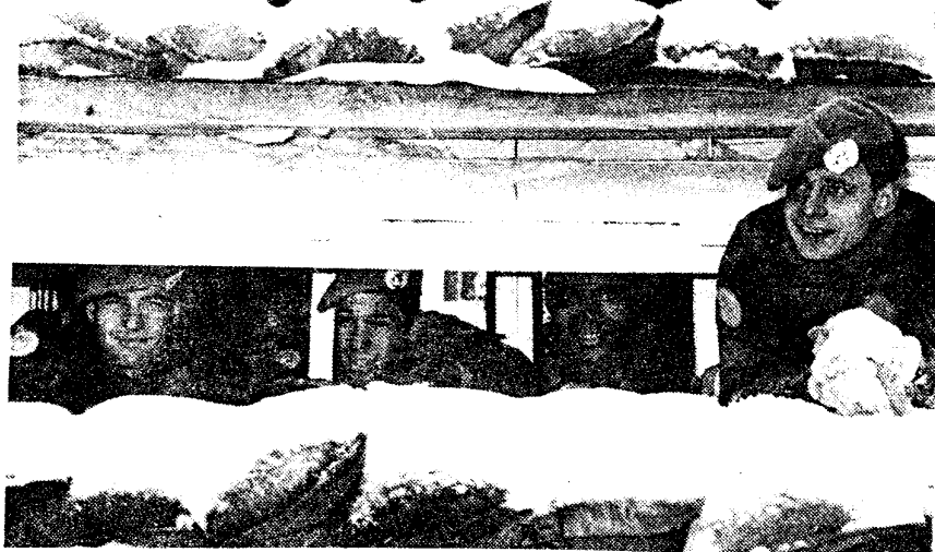
De genisten in een tot wachtpost omgebouwde 'Mad Max-kooi'

De Alpha-genie bestaat voor een groot deel uit rotatie T7. Als ik de periode van november (begin van die rotatie) tot vandaag bezie, is er al onzettend veel werk verricht: