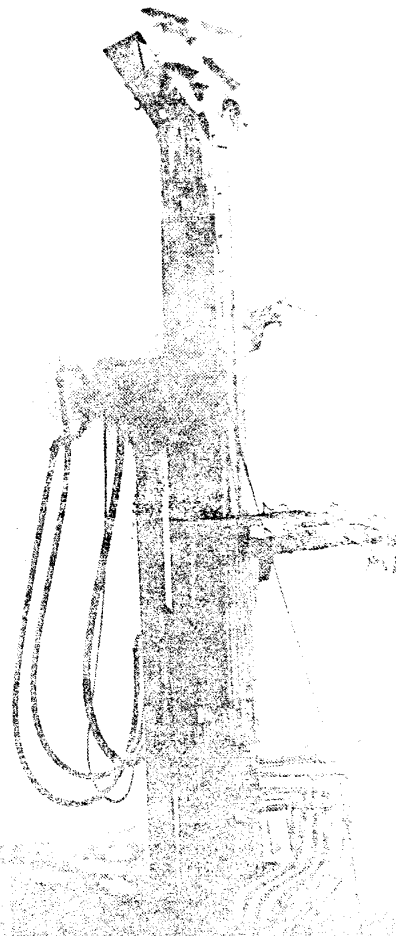
De boortoren spuit zand, kiezel en...water

Het slaan van de bron was voor de Britten 'a piece of cake', een routine-taak. Toch is enige trots op hun werk is gepast. Tenslotte was het pas hun tweede klus in Bosnië. De