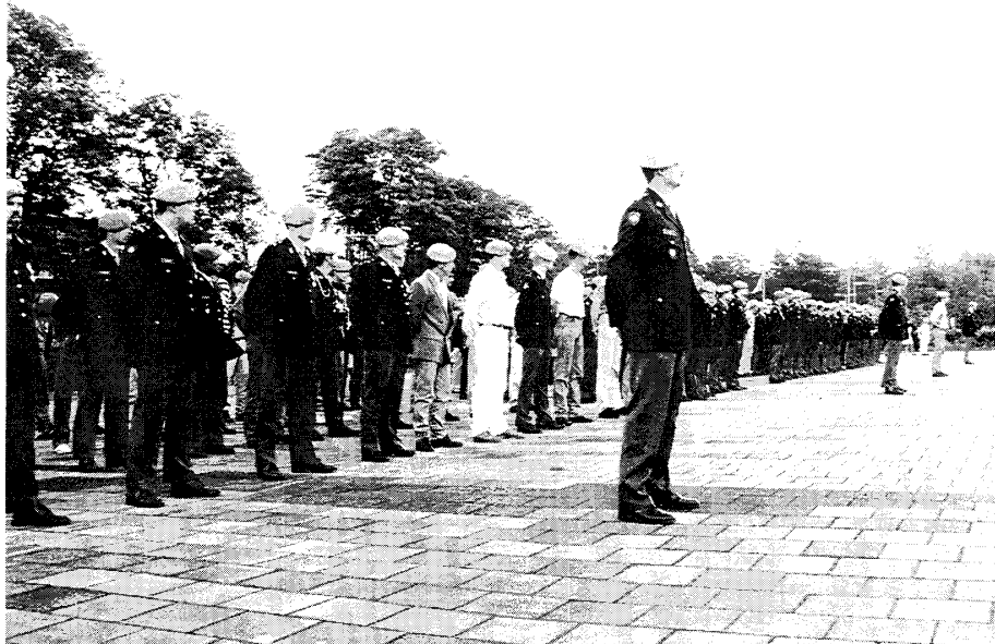
Vrijwilligers van het eerste uur.

De Bevelhebber ging vervolgens nog in op de aspecten in het kader van lessons learned. De Bevelhebber noemde daarin het wachtlopen en het feit dat, hoewel men zich had opgegeven als chauffeur, toch veel wacht moest worden gelopen. Dat is bij dit soort operaties onvermijdelijk. Datzelfde geldt voor de onzekerheid van vertrekdata. "Ik zeg u dat dit ook in de toekomst geen uitzondering zal zijn maar eerder regel, net zo goed als de onzekerheid of een actie wel doorgaat of niet. Daar zullen we mee moeten leren leven", aldus de Bevelhebber terwijl de wind langzaam toenam en de lucht grauwer werd. Tenslotte ging de Bevelhebber nog in op de internationale samenwerking. Samenwerken met Oekraïners of Egyptenaren stelt andere eisen. Daarin hebben we geen keus. We hebben de plicht er het beste van te maken, samen met elkaar. Ik ben blij dat de samenwerking met de Belgische compagnie voortreffelijk is verlopen en nog verloopt.